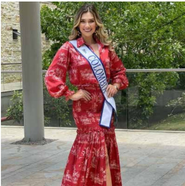
Con paso firme

Un paseo por Cartagena de Indias de la mano de un fotógrafo del diario El Universal le hizo sentir el cálido afecto que le brinda la ciudad.