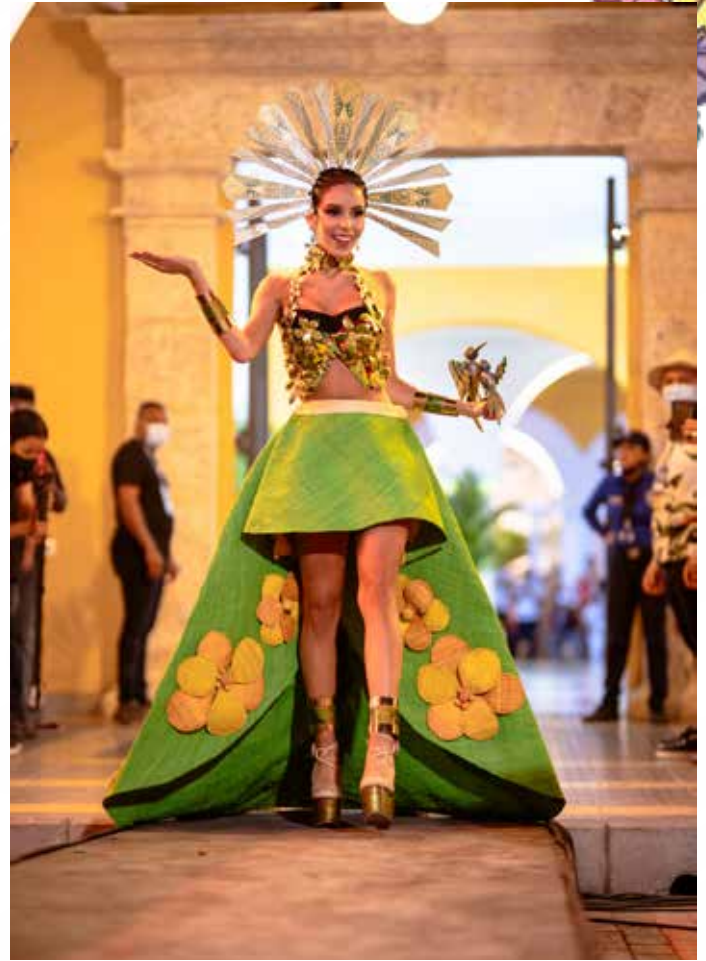
Señorita Nariño®, Mejor Traje Artesanal 2021.

Este emblemático lugar lleno de historia, acogió a las candidatas aspirantes al título de Señorita Colombia®, desempeñando el rol de promotoras de sus departamentos, junto a las candidatas al Reinado de la Independencia de Cartagena. También fue el escenario del Desfile en Traje Artesanal, ratificando que Colombia un país Hecho a Mano®. Con encuentros como éste, estamos comprometidos con el retorno a la normalidad y con la reactivación económica que nuestro país tanto necesita.