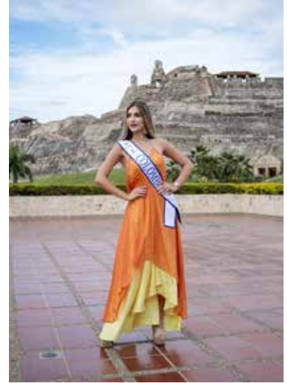
Cartagena es Universal

Muy temprano en Bogotá, acudió a los estudios de RCN para grabar una entrevista en el programa Desayuno RCN, donde compartió con los periodistas del set de televisión. También participó en La Movida de RCN.