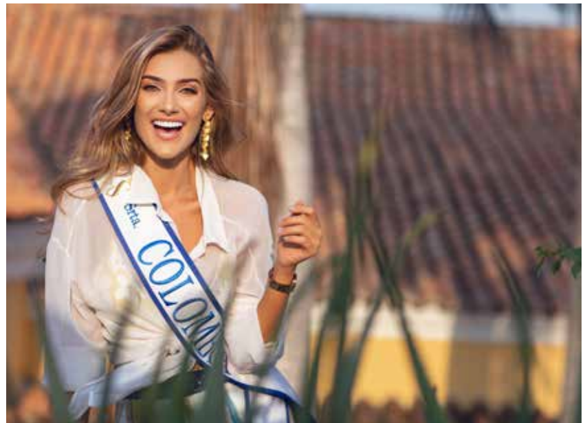
Con Casas en las casas cartageneras

Presente, con paso firme, en la Feria de Calzado y Manufactura EXpoAsoinducals 2021 de Bucaramanga.